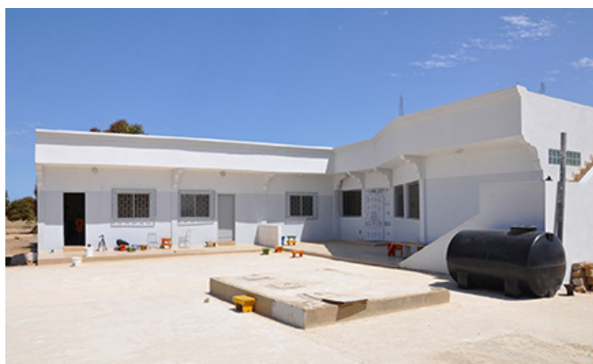
das neue Schul- und Wohngebäude der Kinder

Die feierliche Einweihung des neuen Zentrums in Deni Biram Ndao, Senegal soll im Februar 2011 erfolgen. Dafür planen wir, die Mehrzahl der Mitglieder des deutschen Vereins, eine Reise in den Senegal auf eigene Kosten, um an der Feier teilzunehmen und einige Tage im Zentrum zu verbringen. Die Vorfreude ist groß, vor allem bei denjenigen die bis jetzt noch nicht im Senegal