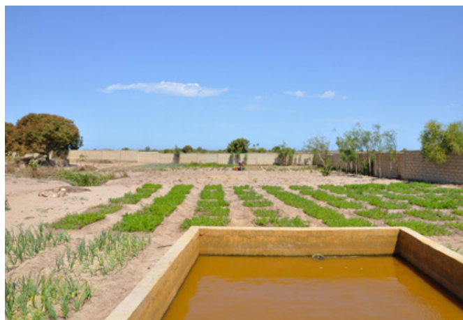
eigener Gemüsegarten im neuen Zentrum